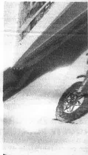
Une rencontre avec François