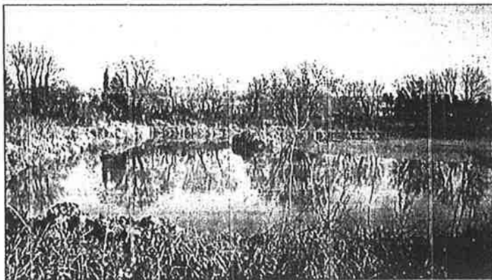
Le nouveau bassin rejoindra-t-il les compétences de l'agglo ?

Depuis les récentes inondations, l'autre partie du trou non comblé forme une magnifique piscine. Un maître nageur à l'esprit taquin qui passait par là, se demande si ce nouveau bassin va rejoindre les établissements gérés par la future aggro ! Plus gravement : jusqu'à quand prendra-t-on le sous-sol de Balaruc-le-Vieux pour une décharge ne disant pas son nom ? ●